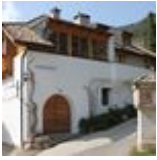
HOF- UND BUSCHENSCHANK Föhrner Buschenschank am Tschöglberg BOZEN