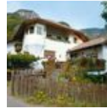
HOF- UND BUSCHENSCHANK Oberlegar Natürlich selbst gemacht. TERLAN