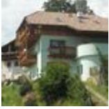
HOFLADEN Roanerhof Frisches Brot! JENESIEN