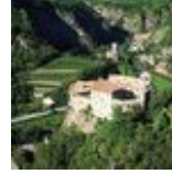
BURG & SCHLOSS Schloss Runkelstein Kontrollpunkt "Runchenstain" BOZEN