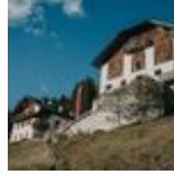
HOFLADEN Oberfreihof JENESIEN