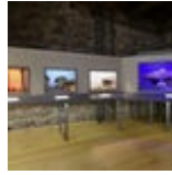
MUSEUM Krippensammlung Kloster Muri Gries Krippen im Kloster BOZEN